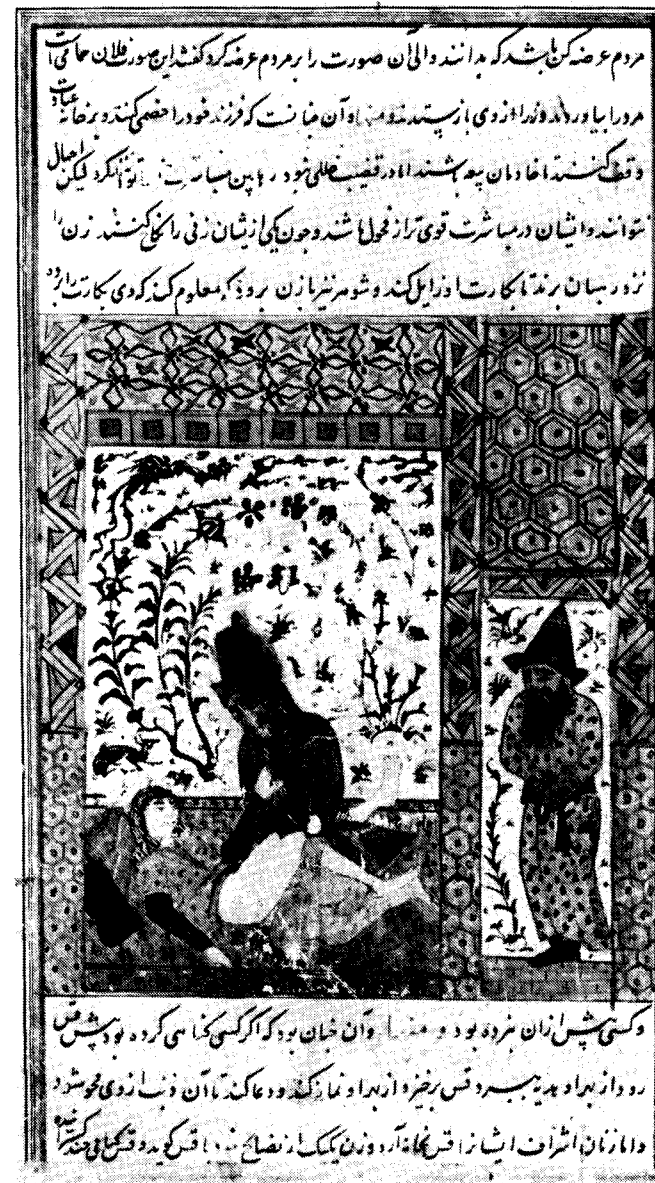
Een priester defloreert de bruid terwijl haar aanstaande echtgenoot toekijkt. Een illustratie van dit christelijke gebruik in de Perzische vertaling van de Cosmografie van de moslimse auteur Zakariya Qazwini (gestorven 1283). Handschrift UB Leiden Or. 8906, f. 174a. (Iran 1602).

Niet dat de formeel dogmatische verschillen tussen de drie monotheïsti-