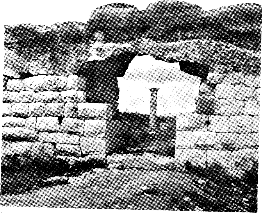
Poort in de muur om de Romeinse stad, tevens het begin van de met zuilen omgeven hoofdstraat, die de stad dwars door midden sneed.