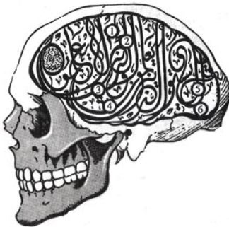
'Tête dure' van Mounir Fatmi.