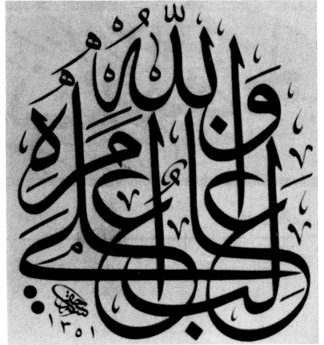
لوحة متراكبة الكلمات بخط ثلث جلي. نصها: «والله غالب على أمره» كتبها الخطاط حقي سنة ١٣٥١ هـ