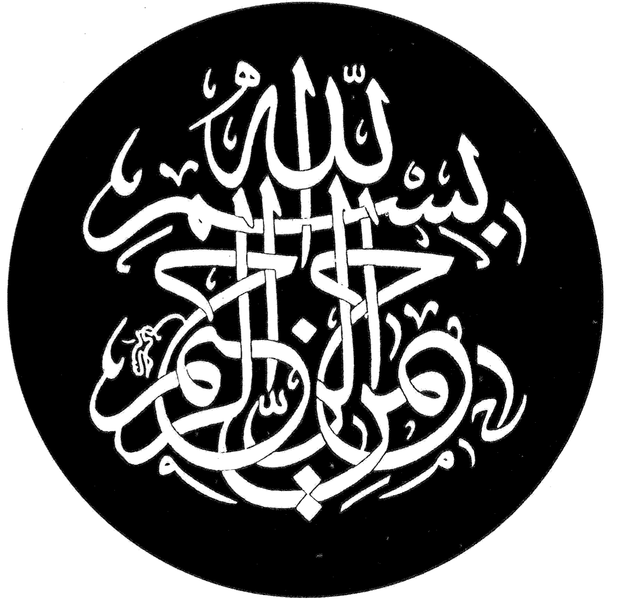
بسملة بخط الثلث، كتابة الخطاط حسني